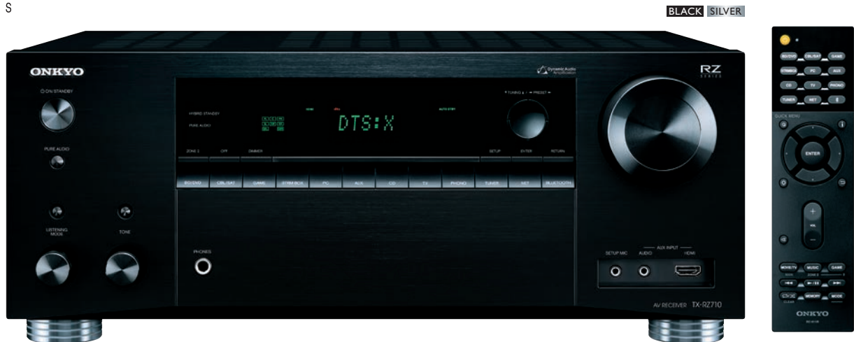
* Изображение ресивера после обновления ПО для декодирования DTS:X